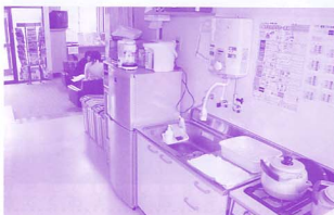
▲炊事場もリニューアル

平成二十年度商工会の大きな事業でありました商工会館改装工事が完了し、玄関を入ったところに会員サロン室を設置しました。 サロン室は会員皆様から土足のままでくつろげる場所を要望されていたもので、事務所を少し縮小して設置したものです。又、炊事場と1階のトイレの改装は約四五万円、一ヶ月間の工事で九月に完成いたしました。 ぜひ、お立ち寄りください。