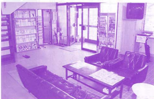
▲広々としたサロン室玄関を望む