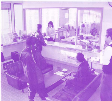
▲会員サロン室から事務室を