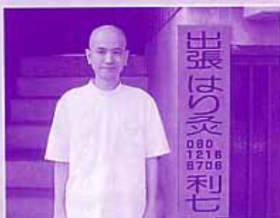
▲糸魚川市と名立区内はどこでも出張 はりきゅう利七 http://web.nou.ne.jp/~hari9ri7/

患者様に心地よい治療を心掛け、「刺さない鍼や」熱くないお灸」も取り入れている。治療内容を分かり易く丁寧に説明してくれるので、鍼灸が初めての方も安心して利用できる。(加藤記)